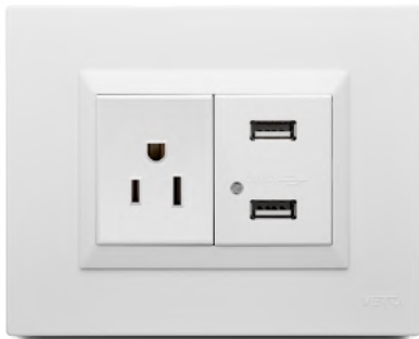
Diagrama de Instalación Base de carga USB