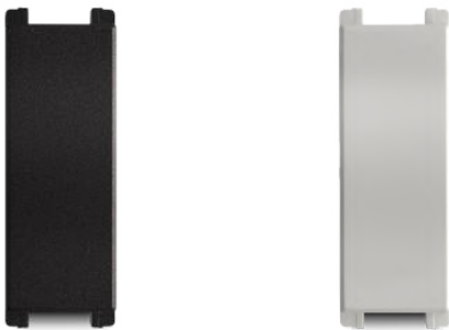
Módulo cubre hueco 24mm