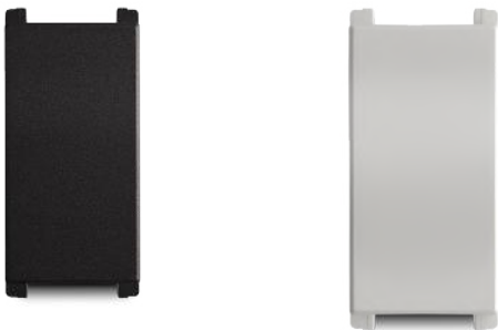
Módulo cubre hueco 36mm