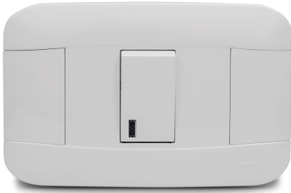
Conmutador doble sin luz piloto