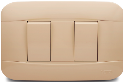
Conmutador triple con luz piloto