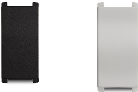
Módulo cubre hueco 36mm