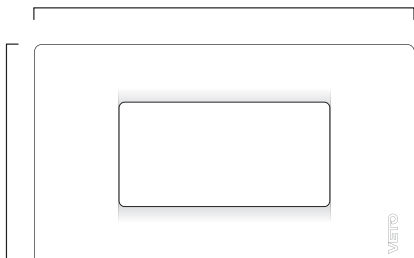
Diagrama de instalación Sensor de movimiento