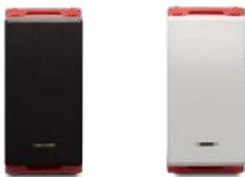
Conmutador 4 vías 36mm