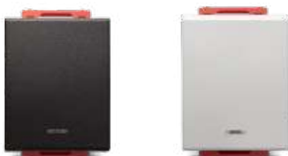
Conmutador 4 vías 72mm