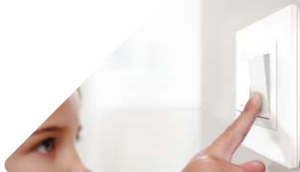
Conmutador 4 vías 24mm